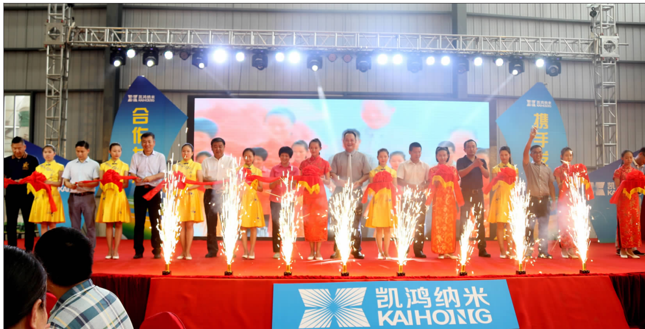
韶关凯鸿纳米材料有限公司举行第一期项目落成剪彩仪式。

本次现场竞拍活动报名一开始,意向企业代表纷纷拿起手机拼手速,扫报名二维码参与竞拍。仅仅10分钟,竞拍量已超预期并不断刷新,竞拍量的快速上升引来