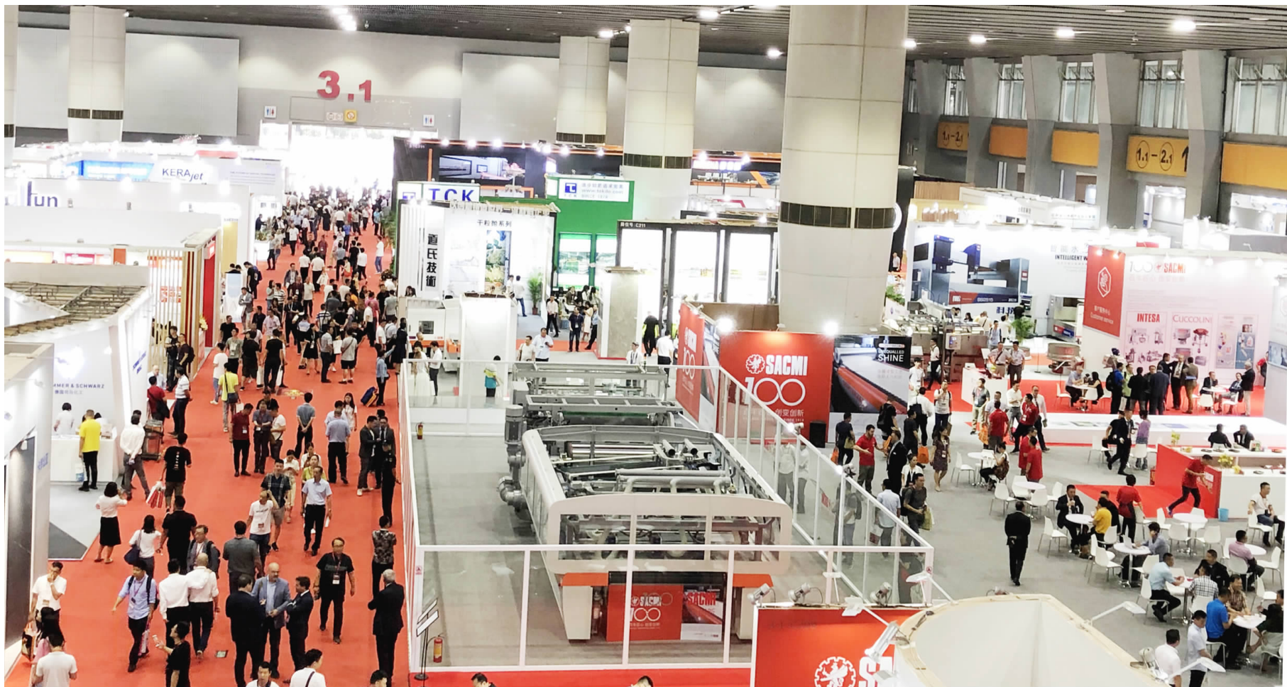
图为2019广州陶瓷工业展现场。

目前,全球建陶装备行业具有整线输出能力的国家,只有中国和意大利。中意两种模式存在一定的差异性和互补性,未来全球一体化的格局,是中意在竞争中,共同引领全球建陶全产业链发展,重构全球建陶装备生态圈。